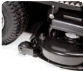
Agregat tnący jest łatwy w utrzymaniu. Można go czyścić przy pomocy węża ogrodowego.

Niezależnie od tego, który z modeli Stiga Estate wzbudza twoje zainteresowanie, możesz być pewien, że są to maszyny łatwe w obsłudze i efektywne. Zostały tak stworzone, by stać się najlepszym urządzeniem ogrodowym w każdym domu.