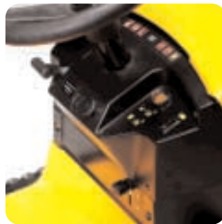
Wszystkie przyciski sterujące znajdują się w dogodnym dla operatora miejscu - stacyjka, akcelerator, przepustnica, sprzęgło agregatu tnącego i regulacja wysokości cięcia.

Nie musisz sprawdzać, czy kosz na trawę jest już przepełniony. Specjalny brzęczyk w odpowiednim momencie da ci sygnał do opróżnienia kosza.